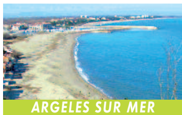
ARGELES SUR MER