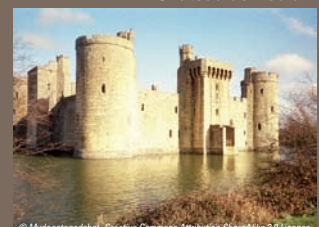
Château de Bodiam