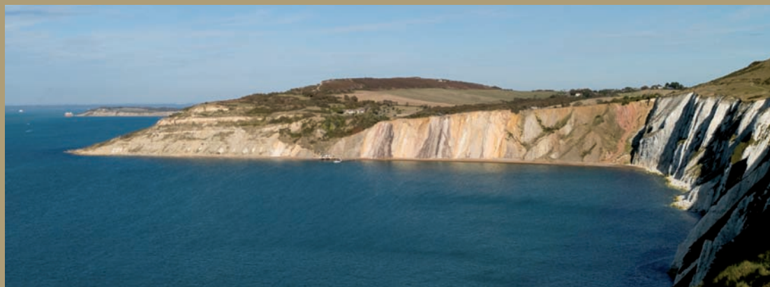
Ile de Wight