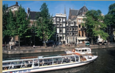
Canaux à Amsterdam