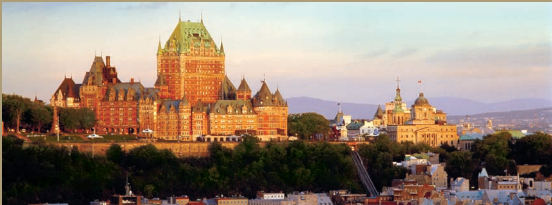
château de Frontenac