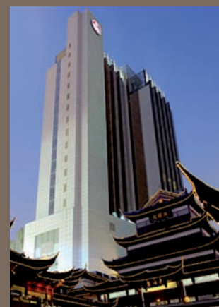
Hôtel Renaissance Yuyuan ★★★★★

J 6. Départ de Shanghai : ➔ sur vol régulier Air France pour Paris. Arrivée à Roissy CdG2. ➔ de Paris-Roissy CdG2 sur vol régulier Air France pour Nantes-Atlantique.