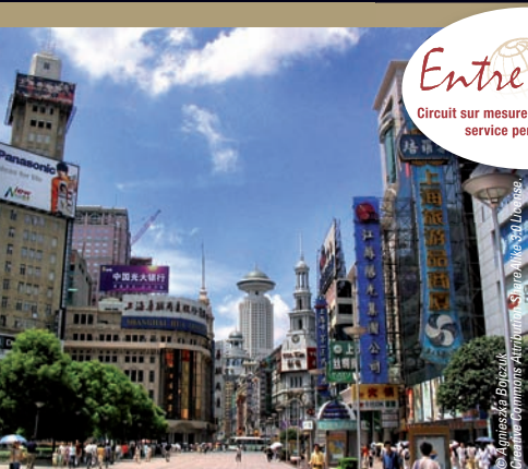
Shanghai - la rue Nanjing