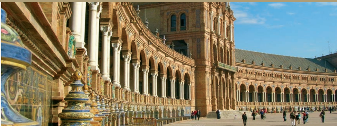
Séville - la place d'Espagne