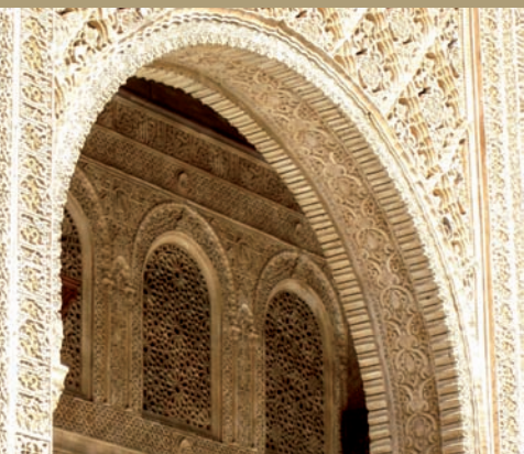
Grenade - l'Alhambra