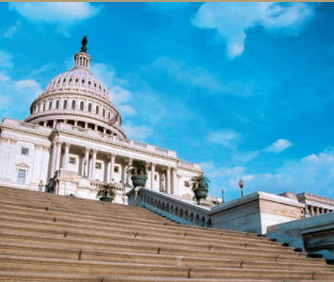
Washington - Le Capitole