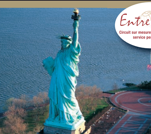
Statue de la liberté