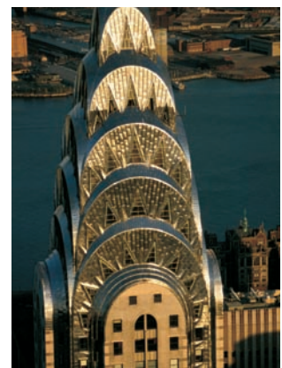
Manhattan - Building