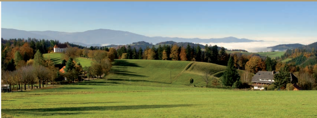
Allemagne - La Forêt Noire