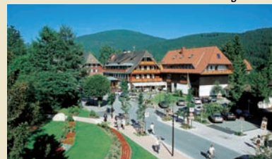
Parkhotel Waldeck Titisee