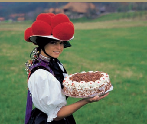
Le chapeau et le gâteau typiques