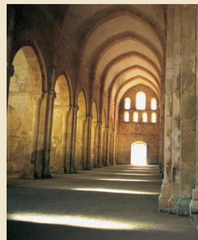
Abbaye de Fontenay

J 14. La Rochelle - Nantes : route vers Nantes . Visite du musée d'histoire , installé dans le château des ducs de Bretagne, qui évoque l'histoire événementielle, géographique, socio-économique, mais aussi les représentations artistiques et littéraires qui ont contribué à dessiner l'identité de Nantes. Le musée donne ainsi les clés pour découvrir et comprendre Nantes et son territoire, depuis la cité gallo-romaine jusqu'aux ambitions de la métropole d'aujourd'hui. ✂. Départ à 16h du TGV 2 ème classe pour Paris .