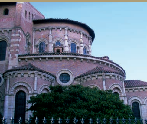
Toulouse - basilique St-Sernin