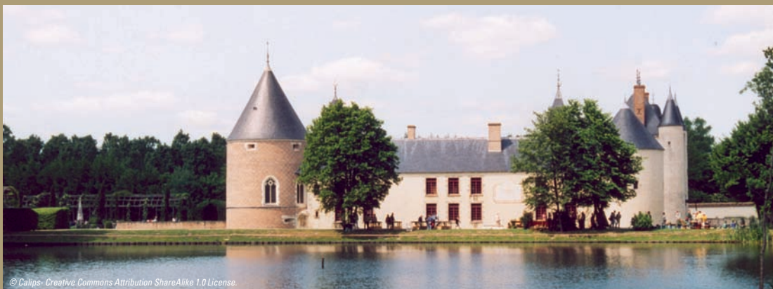
Château de Chamerolles