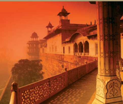
Fort Rouge d'Agra