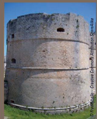
Otrante - Tour du Château

Notre conseil : bonne condition physique impérative. Les nombreux sites et monuments se visitent à pied.