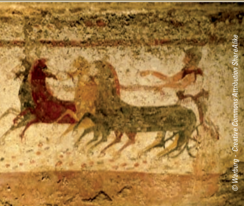
Paestum - Fresque d'une tombe