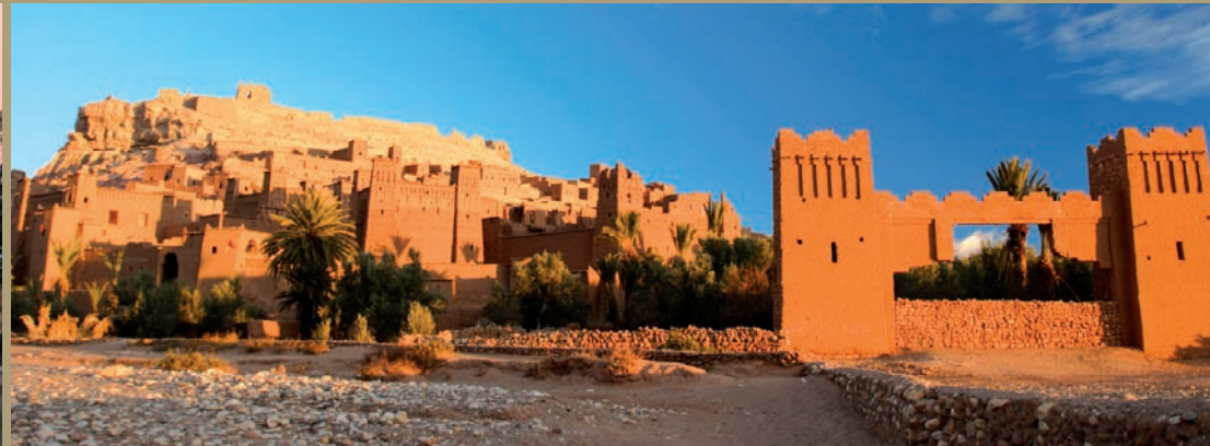
Aït Ben Haddou