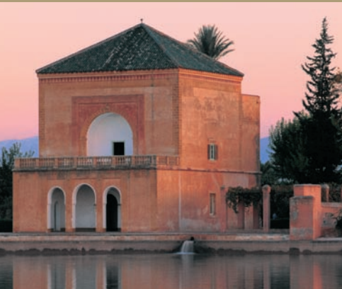
Marrakech - La Ménara