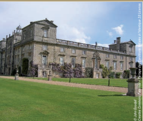
Le palais de Wilton House