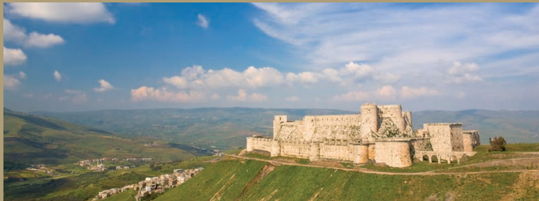
Krak des chevaliers