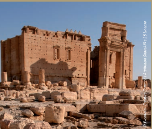
Temple de Bel - Palmyre