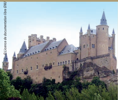
Alcazar de Ségovie