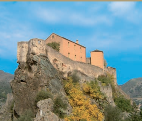
Citadelle de Corte