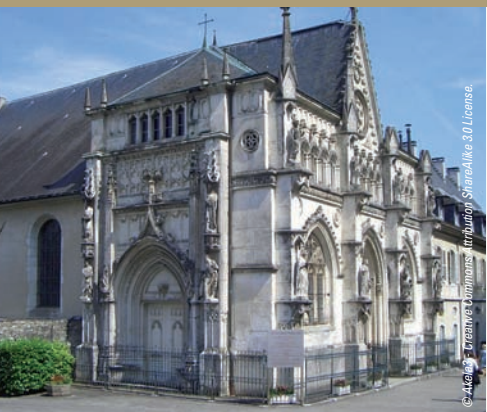
L'Abbaye Royale - Hautecombe