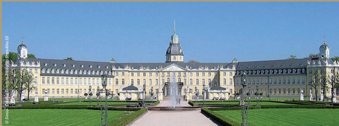
Château de Karlsruhe