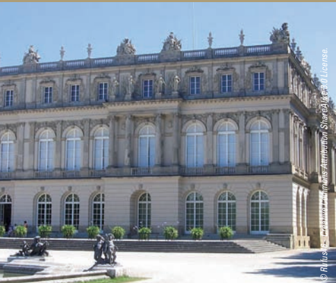
Château de Herrenchiemsee