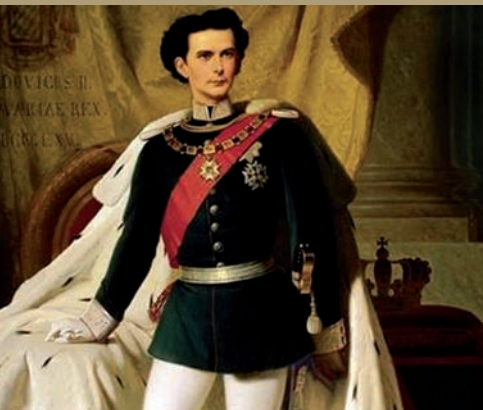
Louis II de Bavière