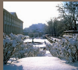
Château de Mirabell

Ce prix comprend : • Le transport en autocar Royal Class • Le séjour en pension complète en hôtels 3 et 4 étoiles du déjeuner du J1 au déjeuner du J8 • La boisson incluse lors des déjeuners du 1 er et dernier jours ainsi qu'aux repas à l'hôtel de séjour. • Les excursions et visites selon programme • Les services d'un guide-accompagnateur local francophone du J3 au J6 • Les pourboires des guides locaux • Le port du bagage • L'assurance assistance rapatriement.