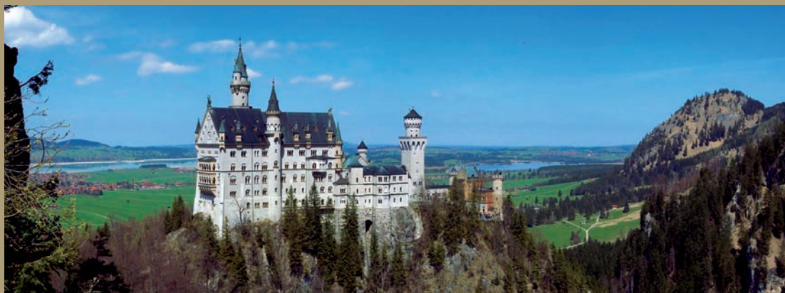
le château perché de Neuschwanstein