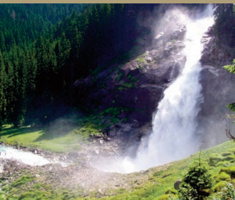
les chutes de Krimml