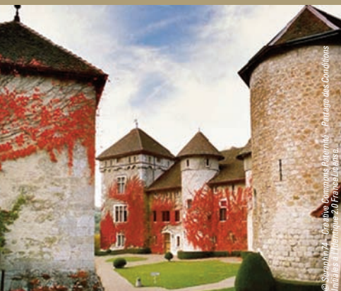
Château de Thorens