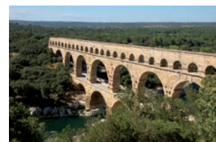
Le pont du Gard

J 7. Retour de Lyon : Auxerre-Nord, ✕. Paris ou Nantes.