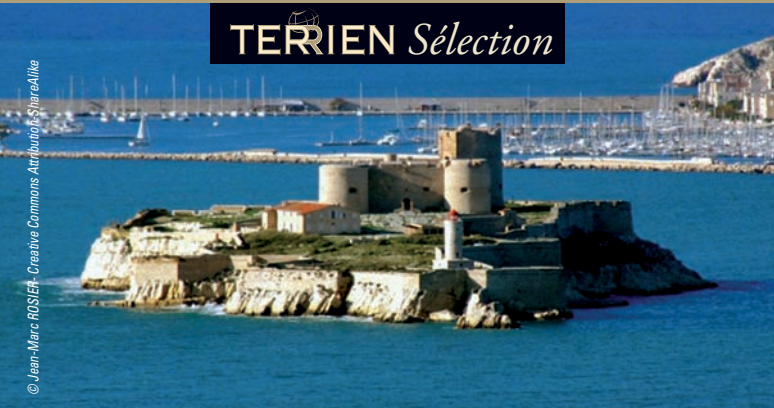
Marseille - Château d'If