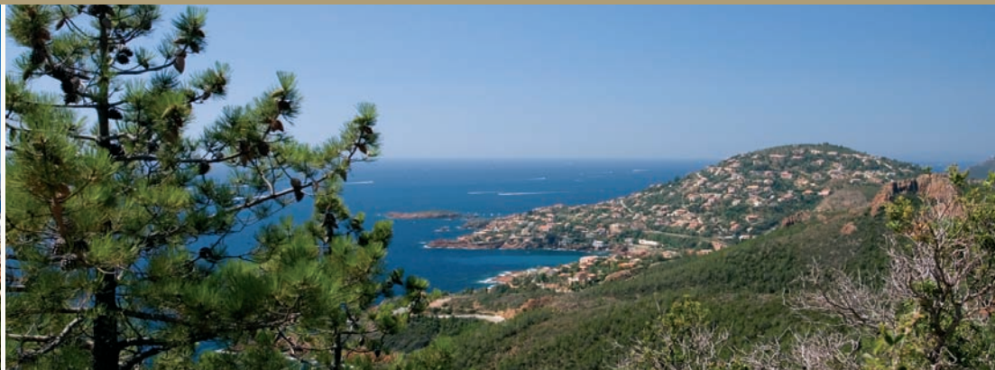
Corniche de l'Estérel