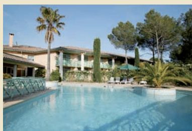
H. Latitude "Golf de l'Estérel"