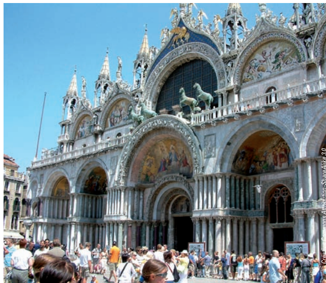
Basilique San Marco

▲ Le déroulement des visites peut se faire dans un ordre différent.