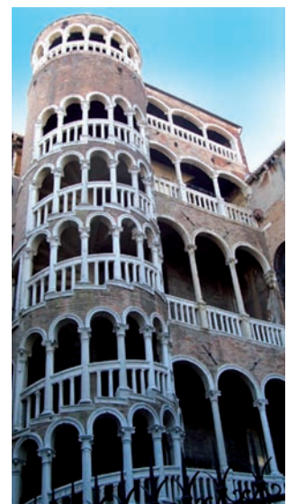
Escalier du Bovolo