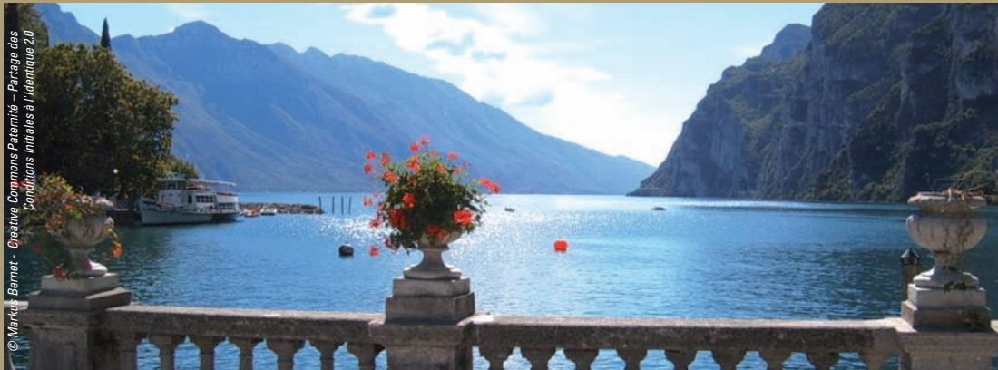
Lac de Garda vue de Riva del Garda