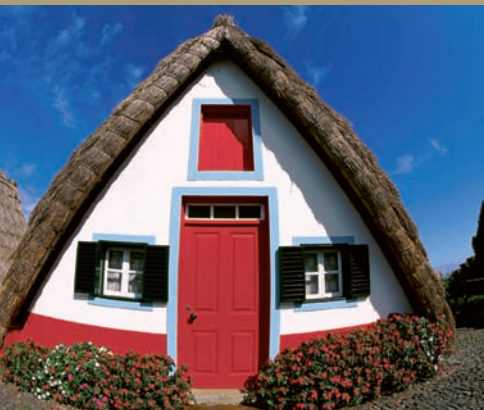
Santana - Maison triangulaire