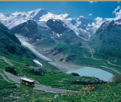
le col de Susten