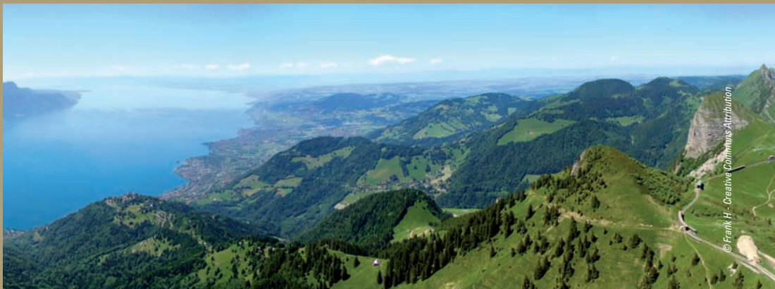
Rochers de Naye