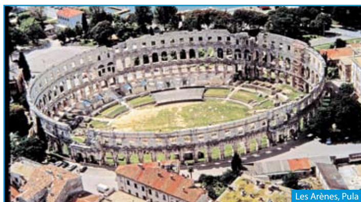
Les Arènes, Pula