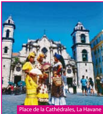
Place de la Cathédrales, La Havane

Départ de votre région si transfert souscrit, sinon rendez-vous à