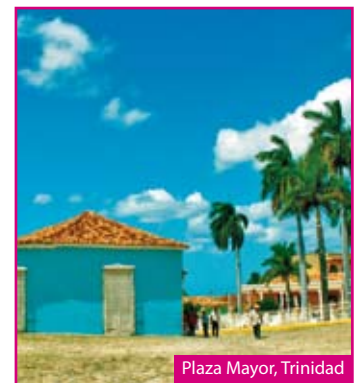
Plaza Mayor, Trinidad

Possibilité d'extension balnéaire à Varadero (3 nuits) Disponibilités et tarifs en demande.