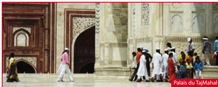
Palais du TajMahal

AU DÉPART DE... VIA PARIS NANTES / RENNES / QUIMPER / LORIENT / BREST / BORDEAUX