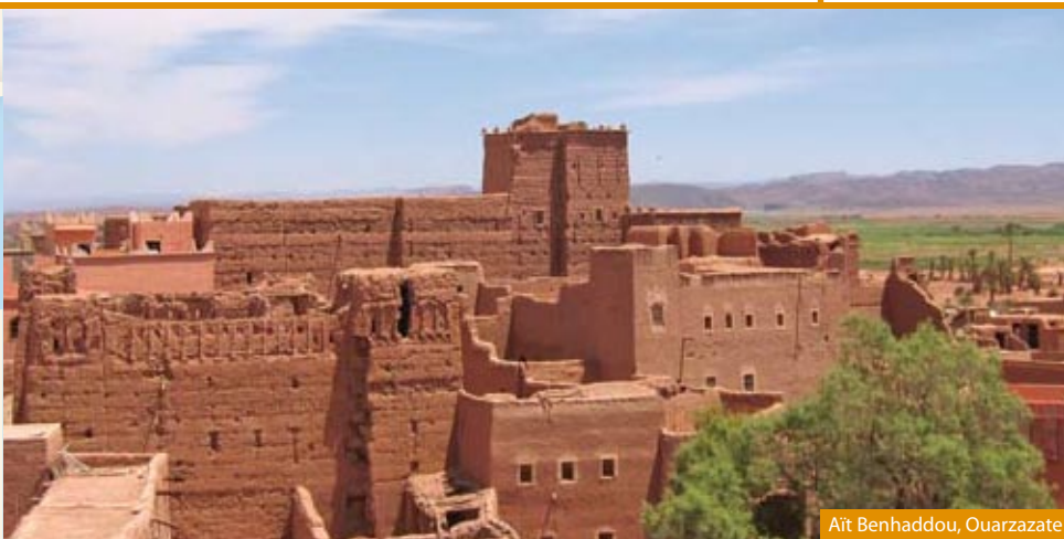
Ait Benhaddou, Ouarzazate