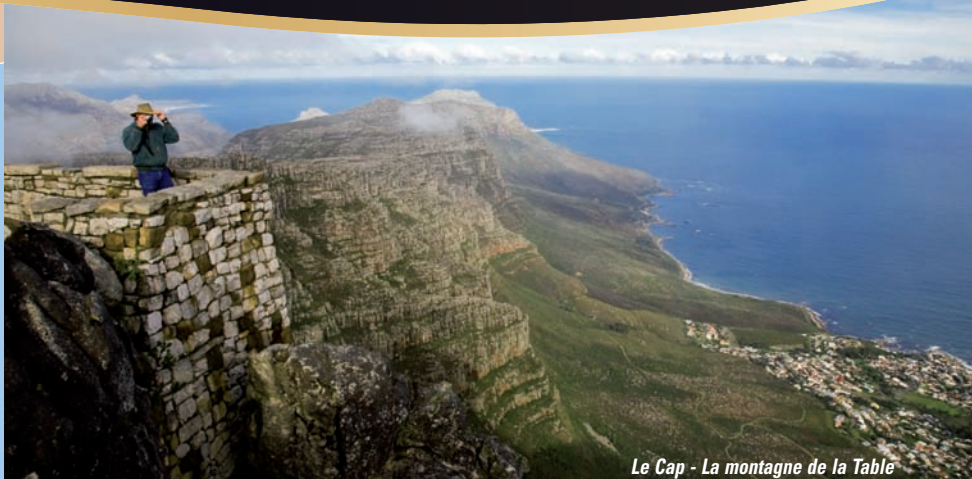
Le Cap - La montagne de la Table