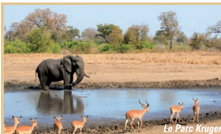
Le Parc Kruger