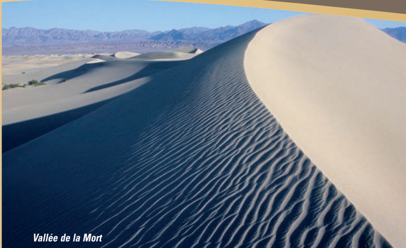
Vallée de la Mort