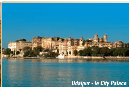
Udaipur - le City Palace