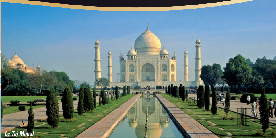
Le Taj Mahal