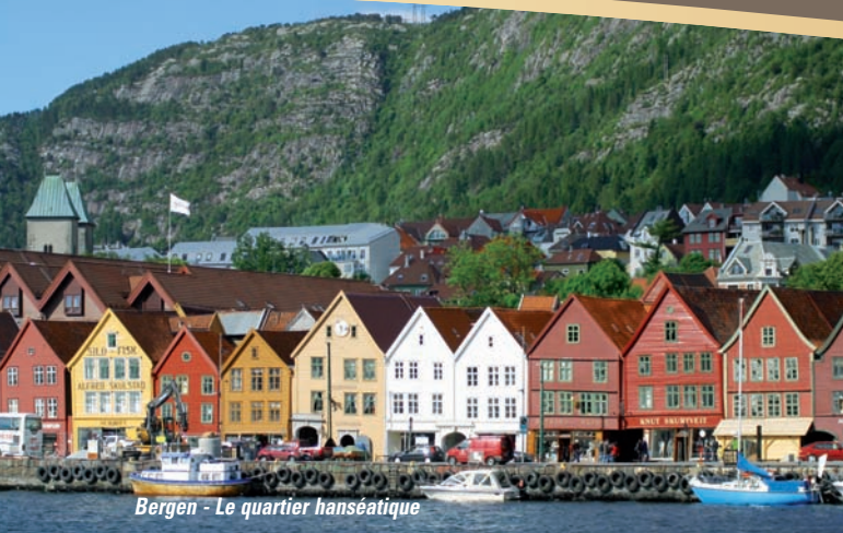
Bergen - Le quartier hanséatique