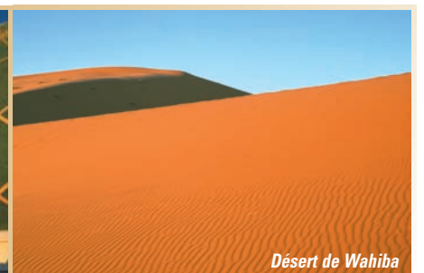
Désert de Wahiba