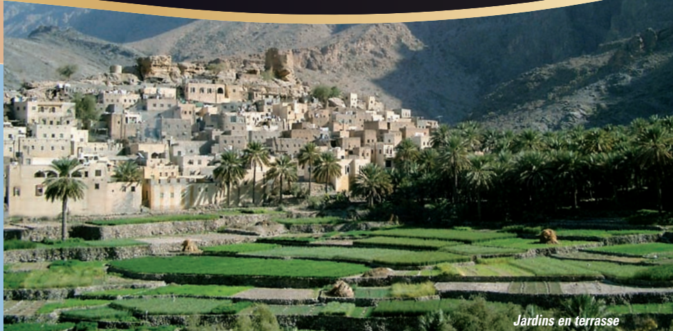
Jardins en terrasse