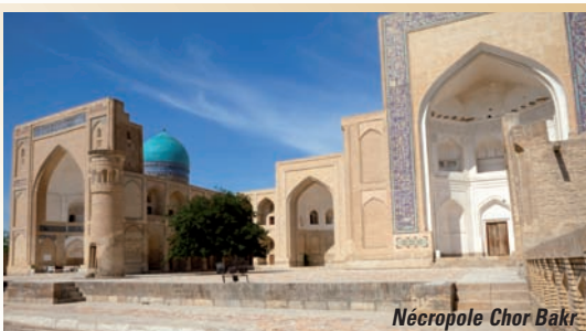
Nécropole Chor Bakr