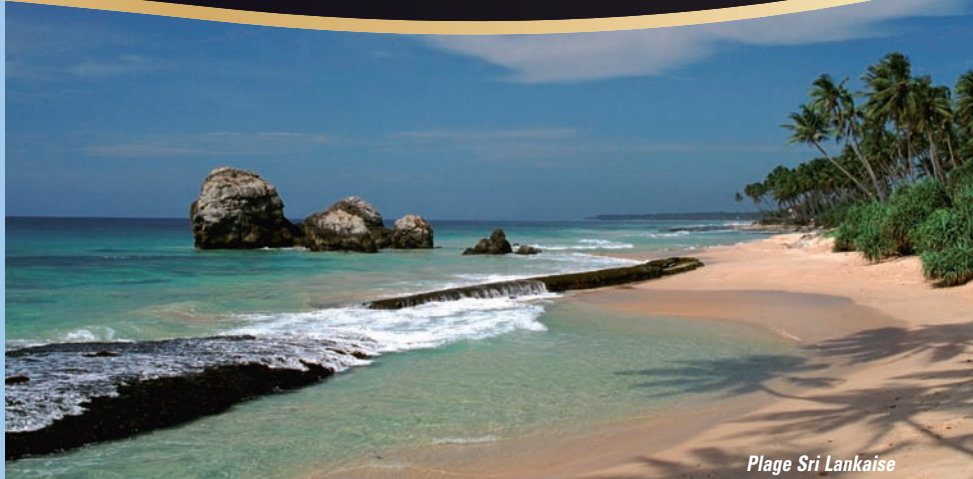
Plage Sri Lankaise