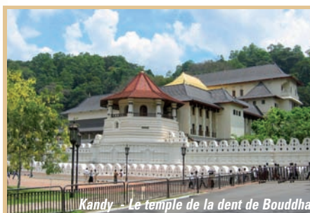
Kandy - Le temple de la dent de Bouddha

Les prix ont été calculés sur la base d'une classe aérienne tarifaire précise, sous réserve de disponibilité à la réservation. Un supplément peut vous être demandé.